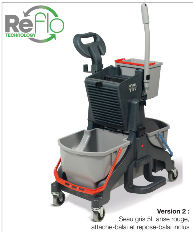
Version 2 : Seau gris 5L anse rouge, attache-balai et repose-balai inclus